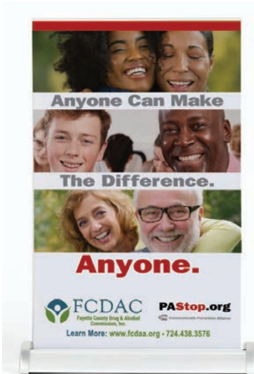
Expositores de mesa