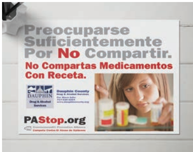
Folletos y carteles