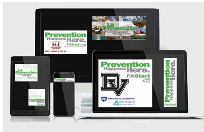
Anuncios y publicaciones en Internet y Redes Sociales