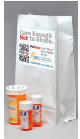
Materiales para socios