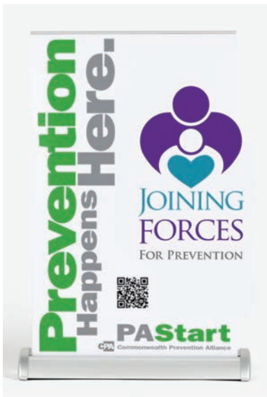
Expositores de mesa