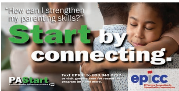
Pantalla digital de exterior