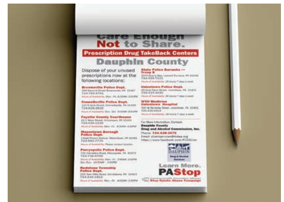
Materiales para los depósitos de medicamentos