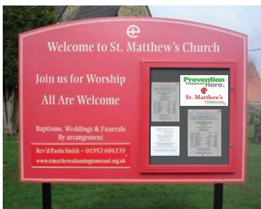
Folletos y carteles