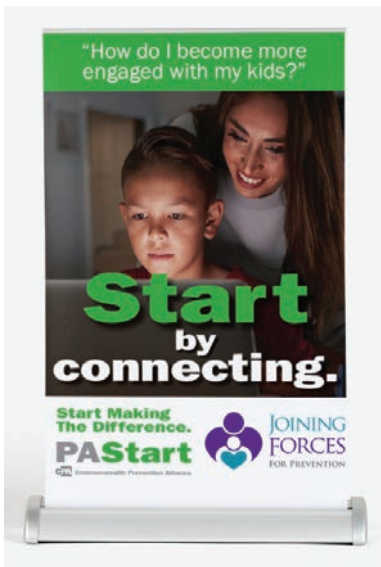
Expositores de mesa