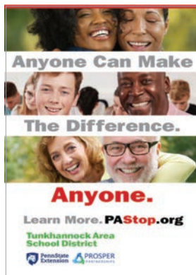
Folletos y carteles