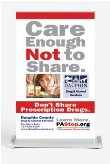
Expositores de mesa