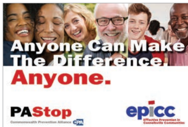
Banners por Correo electrónico