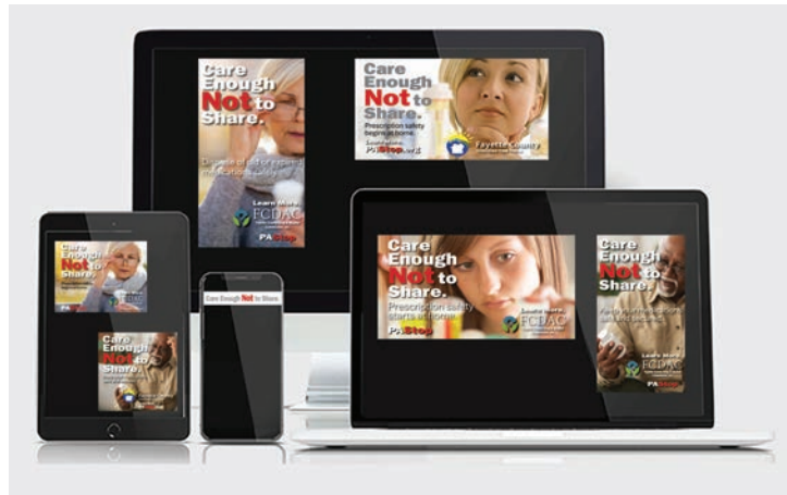
Anuncios y publicaciones en Internet y Redes Sociales