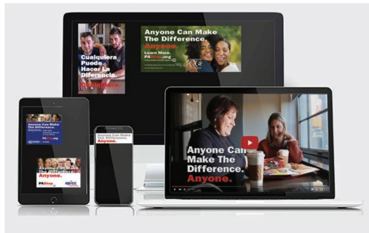
Anuncios y publicaciones en Internet y Redes Sociales