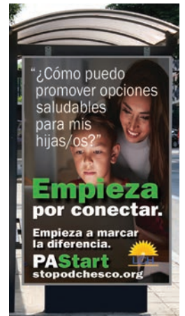
Publicidad en Transporte Público