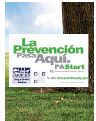
Carteles de jardín